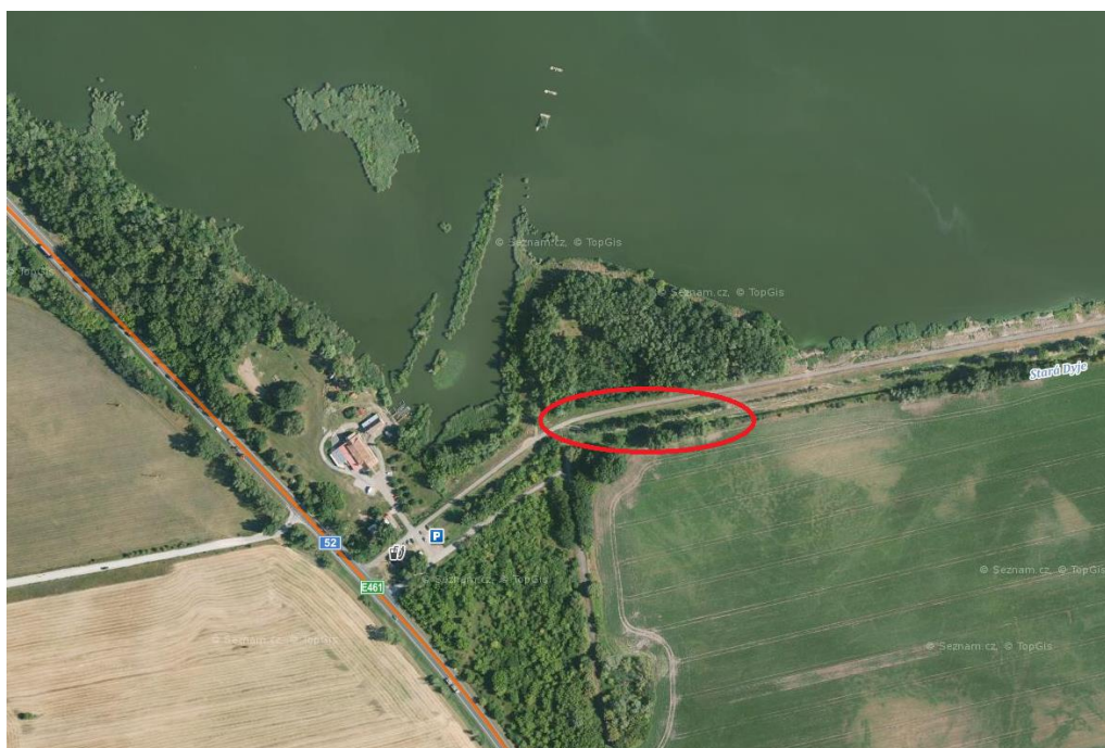
Poloha na jižním břehu

Kácené stromy z parcel Rybníkářství Pohořelice budou ponechány Rybníkářství. Ostatní stromy v blízkosti stavby budou dle potřeby ochráněny bedněním.