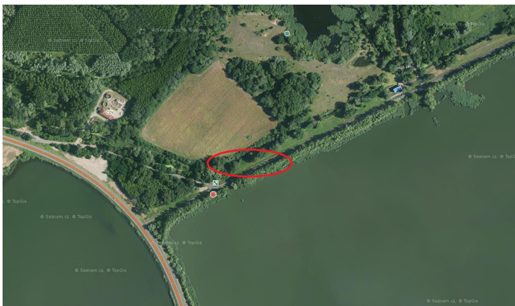
Poloha na severním břehu